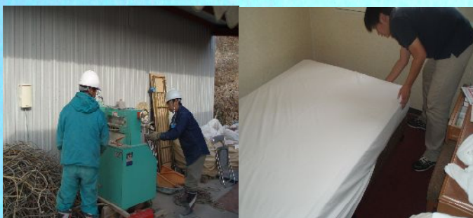
企業での体験実習風景